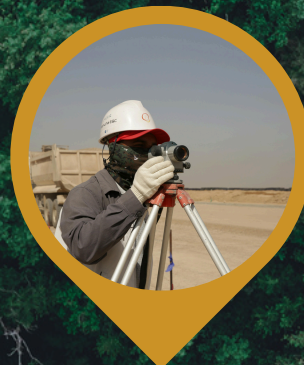
SERVICIOS TOPOGRÁFICOS Y CARTOGRÁFICOS