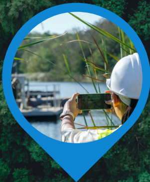
PLANES Y PROGRAMAS DE MANEJO AMBIENTAL