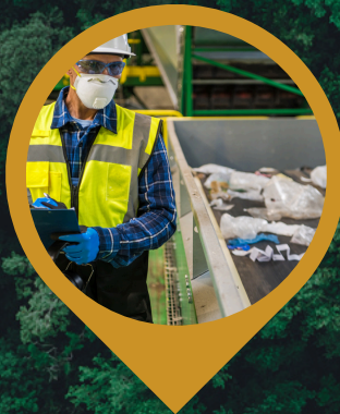
ESTUDIO DE RESIDUOS SÓLIDOS